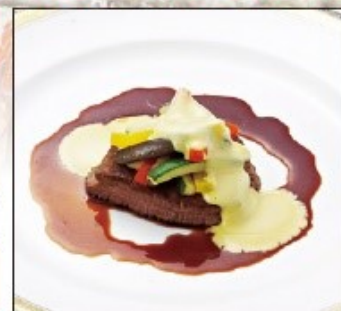
牛肉のポワレ プロヴァンス風

現代風にアレンジした京都有職鳴台盛りと鯛茶漬け、牛肉のポワレプロヴァンス風と季節のポタージュスープをご試食いただけます。和食・洋食とも料理長こだわりの料理をご用意いたしております。