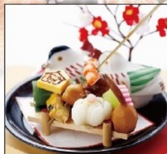
京都有職鳴台盛り